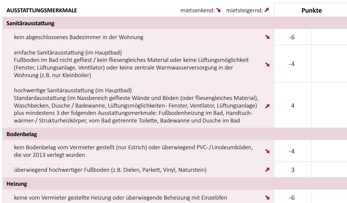
Tabelle 2: Punktwerte für Wohnwertmerkmale, die den Mietpreis beeinflussen

Die in der Tabelle 2 aufgeführten Modernisierungsmaßnahmen können teilweise nur für Wohnungen bis zu einem bestimmten Baujahr berücksichtigt werden, da es sich um „nachträgliche“ Modernisierungsmaßnahmen handelt. Die Modernität / der gute Erhaltungszustand der Ausstattung von Wohnungen mit jüngerem Baulter kommt in einem höheren Basispreis in Tabelle 1 zum Ausdruck.